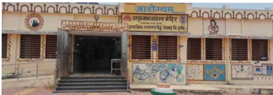
हरिभूमि न्यूज़ | तेजगढ़

कर्मचारी आनलाईन करवा रहे चेकअप, नर्स लिख रही दवाईयां