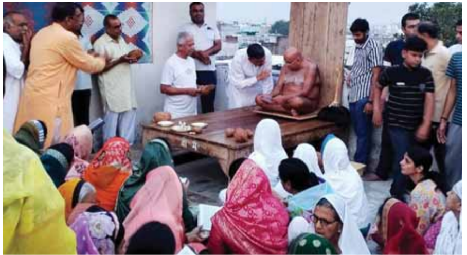
हरिभूमि न्यूज़ | दमोह